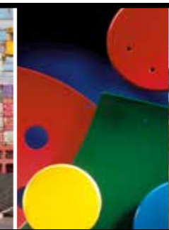
BOUWELEMENTEN EN PROFIELEN VAN PE (VOOR SPEELTUINEN)