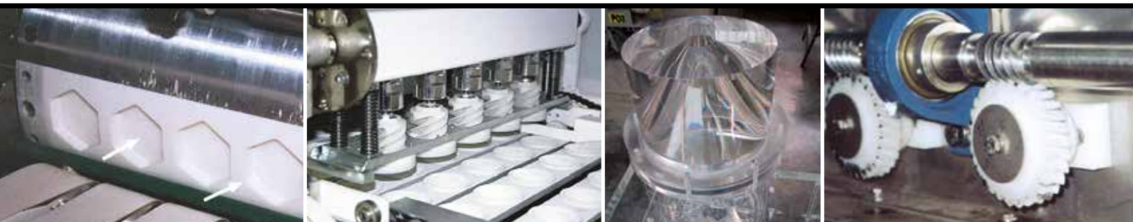
Koekjesvormen in PET Loopbanden in PTFE