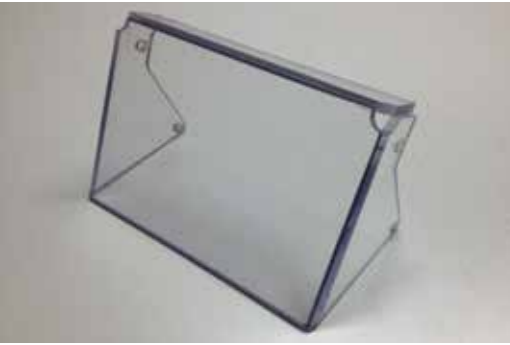
THERMOFORMAGE EN PLOOIEREN: AFSCHERMKAPPEN EN LOPERS IN PC EN PET-G