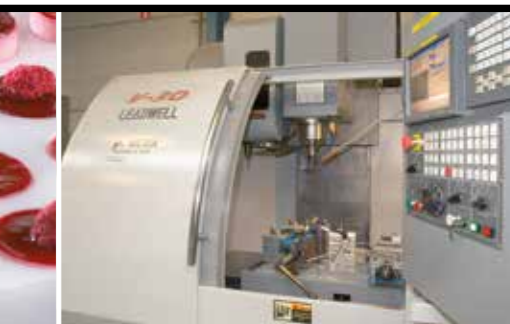
AFSCHERMKAP OP FREESMACHINE IN PC