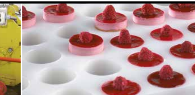
VORMPLAAT IN PE (PATISSERIE)