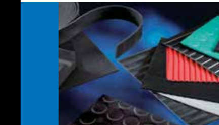
UITGEBREID ASSORTIMENT VAN TECHNISCHE RUBBERS EN SYNTHETISCHE MOUSSE: MATTEN, LOOPPLANKEN, PLATEN, BUIZEN, STAVEN, SCHUIMEN, ETC.

PlastiService, dat is ook: een breed gamma van rubbers, synthetische schuimen en kunststofslangen