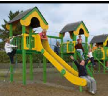
WIELBLOK IN PUR