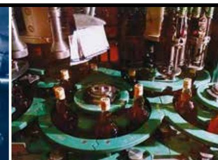
GELEIDINGSPROFIELEN IN (UHMWV) PE (FLESSENAFVULMACHINE)