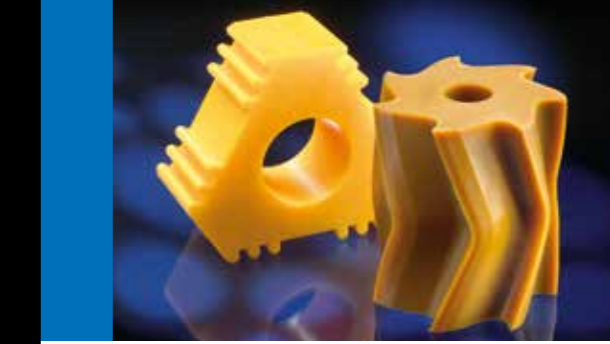
VORMGIETEN EN KLEVEN VAN RUBBER, ERTANE EN SILICONEN: ONDERDELEN VOLGENS PLAN, ETC.