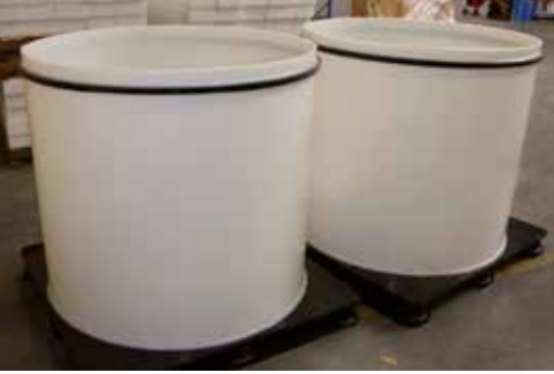
PLASTIC VATEN VAN KLEINER VOLUME

PlastiService, dat is ook: een breed gamma van rubbers, synthetische schuimen en kunststofslangen