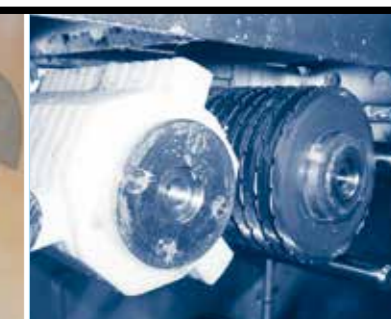
HAKMESTROMMEL IN POM (GROENTENHAKMACHINE)