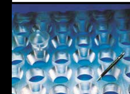
CONTROLETAFEL IN PC (ELEKTRONISCHE ASSEMBLAGE)