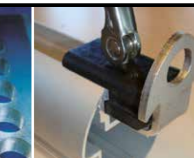
SPANKLEMMEN IN PA (TWEEDELIG)