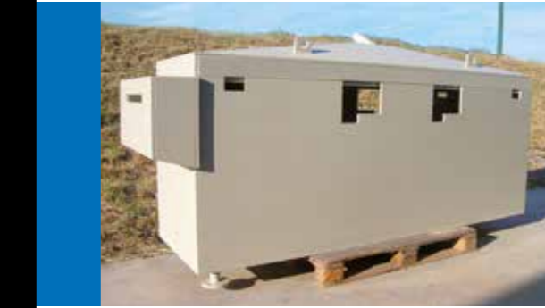
VERLUMEN, LASSEN EN ASSEMBLEREN VAN PP, PE EN PVC