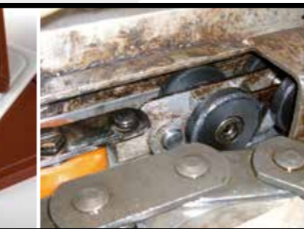
STOOTBAND IN PE (GROOTKEUKEN)