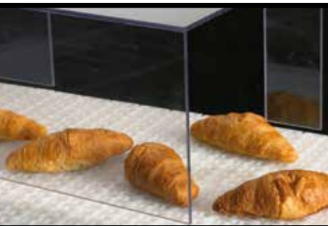
BESCHERMKAP IN PC (BAKKERIJ)