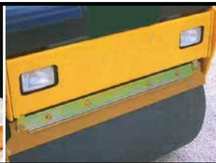
REINIGINGSSTRIP IN PUR (WEGENONDERHOUD)