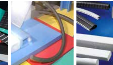
EEN BREED GAMMA PROFIELEN, OMHULSELS EN ELASTOMEREN